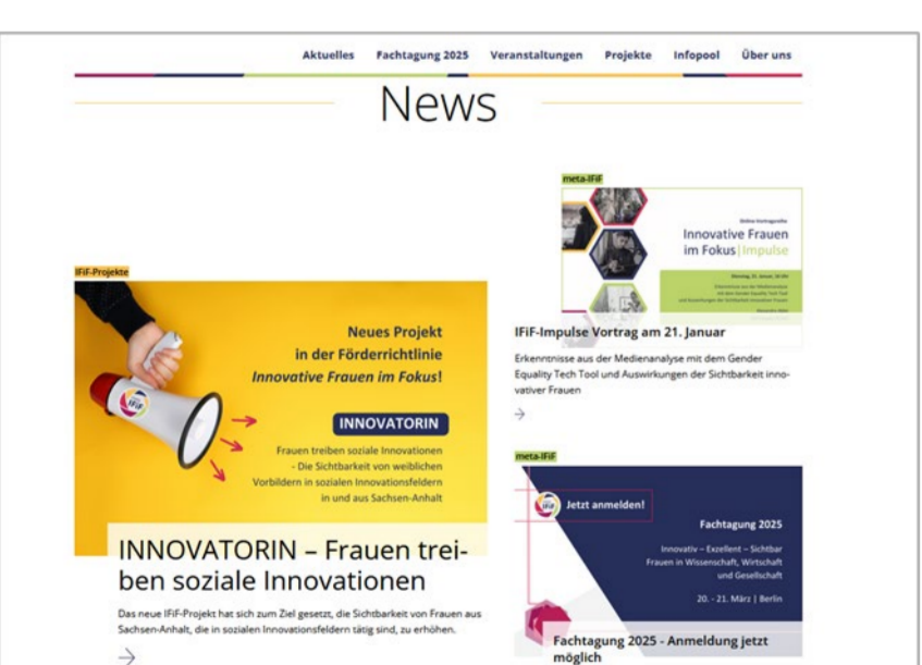
www.innovative-frauen-im-fokus.de : Website mit News und Terminen aus den IFiF-Projekten und dem Themenfeld „Sichtbarkeit innovativer Frauen“.