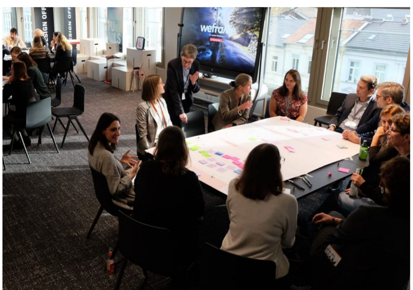
Vernetzungsveranstaltungen gemeinsam mit den IFiF-Projekten