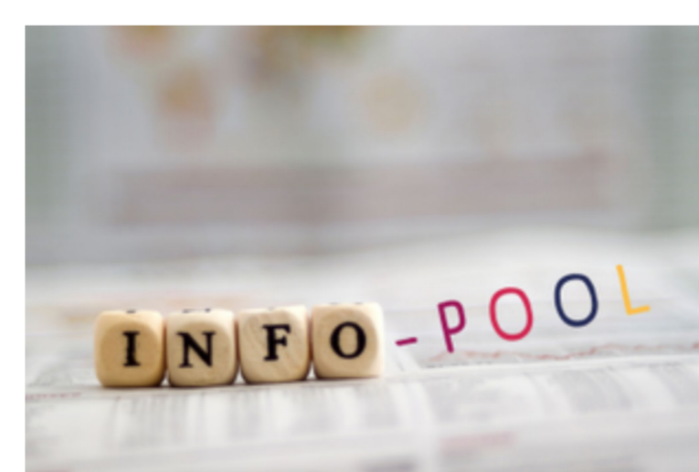
Informationspool auf der Website