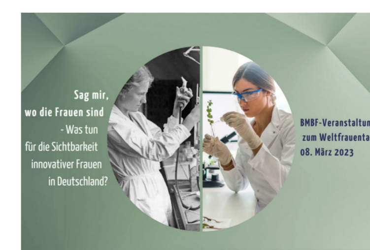
Zentrale Veranstaltung zum Weltfrauentag 2023